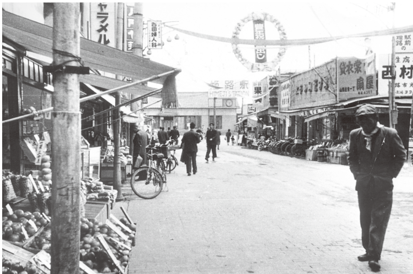
「戦後の姫路」